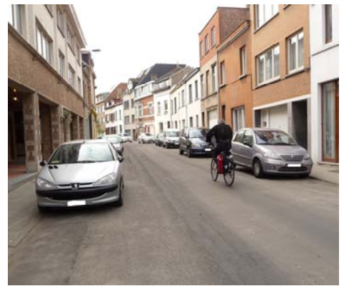
La vitesse des automobiles et les vélos à contre sens furent deux des points discutés lors de la réunion.

En résumé, un casse-vitesse, des signaux peints au sol et peinture de la ligne blanche avenue Jacques Brel Roodebeek sont les petits travaux qui peuvent se réaliser rapidement. La modification des flots de circulation ne peut se faire que