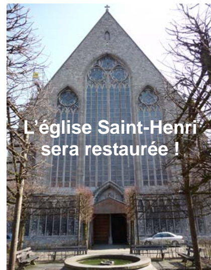
L'église Saint-Henri sera restaurée !

Parallèlement aux travaux urgents, les diverses autorités concernées ont analysé le rapport du bureau d'architecture afin de définir, de manière concertée, les priorités de rénovation, définir un cadre précis de rénovation, aborder la question des subsides, préciser