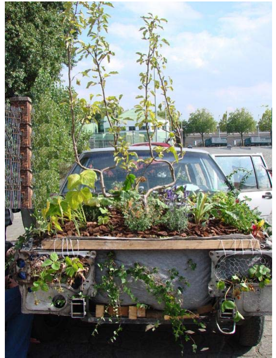
Petit clin d'œil ! Voici enfin l'automobile durable. Action menée dans le cadre de la Semaine de la Mobilité 2007 par auto-suffisance : www.auto-nomie.be

Le 26 mai dernier, la Cellule Mobilité de la Commune nous a invité à une réunion à laquelle participaient également la section locale du CRACQ (Les cyclistes quotidiens) et les Ateliers de la Rue Voot, en plus du bureau d'études Tritel (chargé de l'étude) et de la coordinatrice de l'Agenda 21. Cette réunion a permis aux associations de mettre en avant les problématiques relevées en matière de mobilité depuis des années. Ainsi, Wolu-Inter-