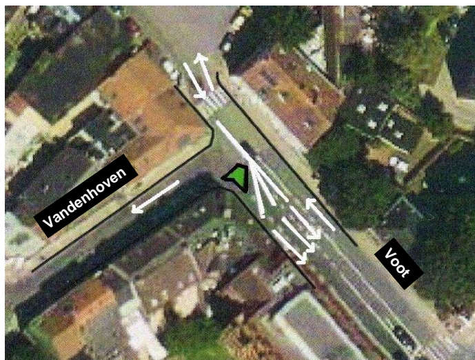
Les circulations automobiles ↑ et les circulations cyclistes ↓

Cette fiche est portée par le comité de quartier Rue St-Lambert.