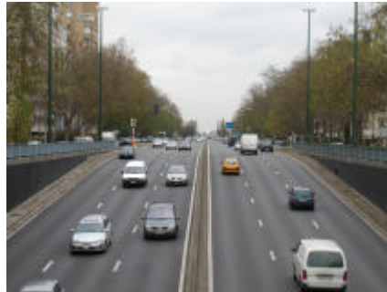
Montgomery-Meiser : un axe qui mérite une requalification en boulevard urbain à dimension humaine.

Un groupe de travail s'est mis en place afin de mener à bien une réflexion sur cet axe qui, véritable autoroute urbaine, est une source de nombreuses nuisances. Wolu-Inter-Quartiers, en collaboration avec les membres du groupe de