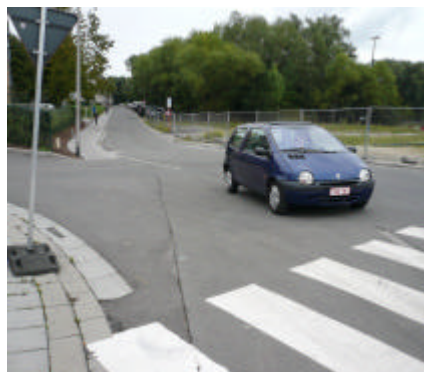
Ex. d'1 fiche : le coin Neerveld/Bobesco/Hymans manque de lisibilité pour toutes les circulations : une signalisation claire y est indispensable

Nous avons également édité une nouvelle série de fiches techniques en ce qui concerne la mobilité : 93 fiches au total. Pour rappel, ce travail vient illustrer notre Charte de la mobilité pour Woluwe-Saint-Lambert, éditée en 2002. Plutôt axées sur la mobilité des piétons et des cyclistes, elles furent élaborées dans le cadre de « La semaine de la mobilité » et présentées à la