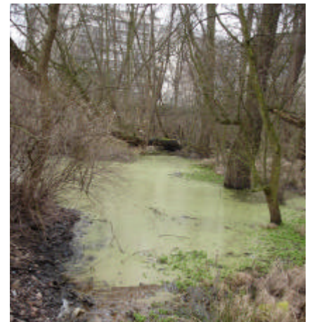
Le bosquet marécageux Hof ten Berg : un espace dont le biotope est à préserver face à l'urbanisation de la vallée de la Woluwe.

En matière d'urbanisme , notons le suivi des enquêtes publiques ; une quinzaine en 2007. Citons parmi celles-ci le projet de lotissement sur le bassin d'orage de Roodebeek, plusieurs enquêtes sur le site du Val d'Or, le cahier de charges de l'étude d'incidences pour l'extension du Woluwe Shopping Centre, l'implantation d'un parking de bus pour l'école européenne ou encore diverses demandes d'implantation de logements en intérieur d'îlots.