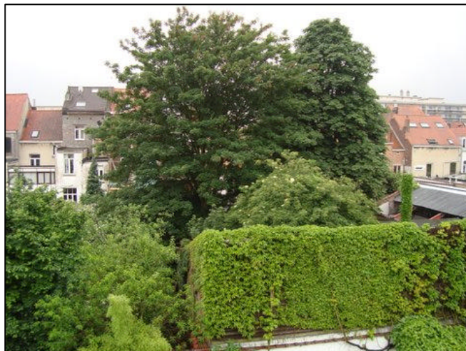
Vue de l'intérieur de l'îlot où il est prévu la construction de deux maisons alors que cette zone de jardin pourrait être valorisé en un espace paysager de qualité.

Ce cas de figure illustre combien il est important de ne pas s'avouer vaincu trop vite et de toujours ré-