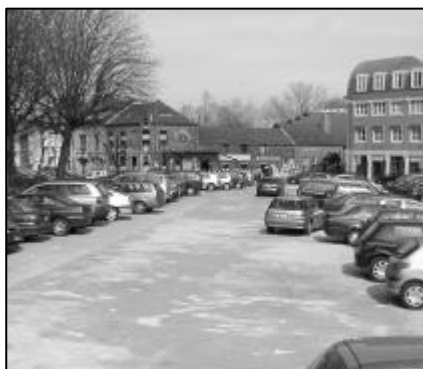
Le centre de la place St-Lambert est transformé quotidiennement en parking illégal, sans doute par les commerçants !