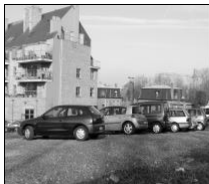
Pour créer un parking provisoire illégal à la chaussée de Stockel, on n'hésite pas à poser des tonnes de gravillons au sol afin de le rendre plus carrossable !