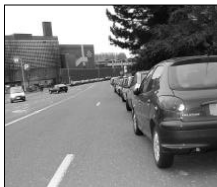
Le stationnement le long d'une ligne pointillée rue St-Lambert, supprimant ainsi une bande de circulation, provoque de nombreux embouteillages aux abords du Shopping !