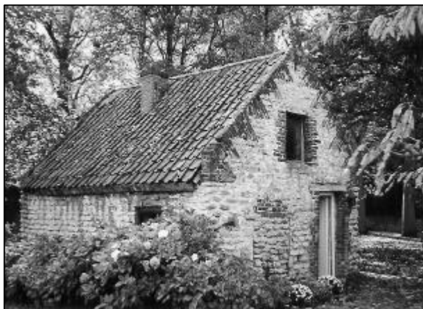
Le fournil qui est situé vers le fond du jardin, est un des bâtiments aujourd'hui classés.

A suivre. Sources d'informations : musée communal.