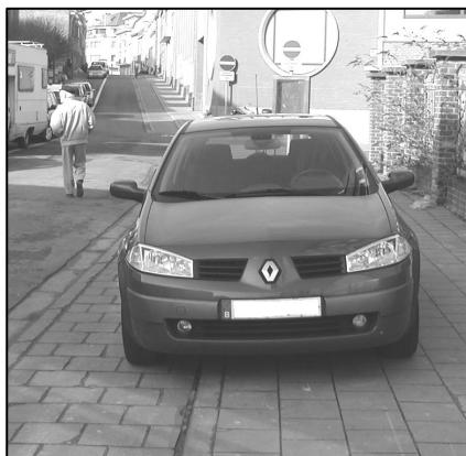
Un classique : la piste cyclable de la rue Monnens utilisée « un instant » en parking !

nets de façade en parking, zone verte affectée en aire de stationnement, livraison en double file,... toutes situations illégales, deviennent à la longue de moins en moins perçues comme une infraction. Et, tenter de faire une réflexion à un de ces automobilistes indisciplinés vous permettra de réactualiser à peu de frais votre dictionnaire d'injures.