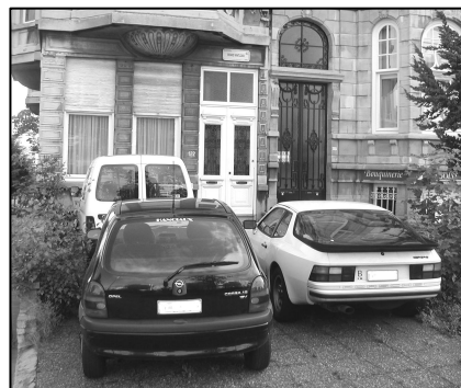
De nombreux jardins de façade sont transformés en super parking sans aucune autorisation !

tante bénévole a regalé une soixantaine de personnes. La salle a été décorée par les enfants du quartier qui avaient participé à un atelier de bricolage avec JYJY.