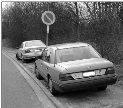
Chemin des Deux maisons : un parking régulier sur la zone verte à haute valeur biologique du Val d'Or !

Stationnement en double file, arrêt sur passage piéton, emprise sur le trottoir, transformation d'un terrain vague en zone de stationnement temporaire, affectation de l'espace central d'une place en parking, stationnement le plus près possible de..., transformation des jardi-