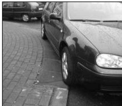
Un coin de trottoir, aménagé pour les personnes à mobilité réduite, rendu inutilisable !

Ce fut une belle réussite : le couscous préparé par une habi-