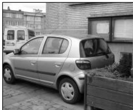
A la maison communale, ce véhicule est garé tellement prêt du mur que vous ne pourrez pas lire les informations publiques affichées aux valves !