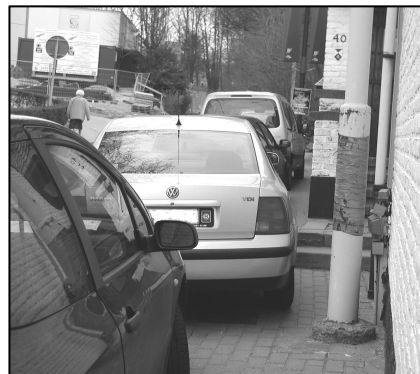
N'essayez pas le trottoir de la rue de la Charrette, vous n'avez aucune chance !