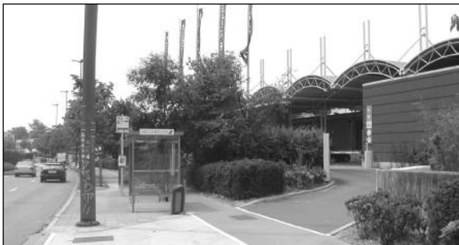
Un des aspects les plus positifs du réaménagement du Shopping a été la construction d'un grand quai de livraison du côté du boulevard de la Woluwe.

Non pas tout à fait. Il faut d'abord savoir que nous déployons avec les riverains une constante pression pour faire avancer certains aménagements qui traînent. Il reste de nombreux détails à améliorer.