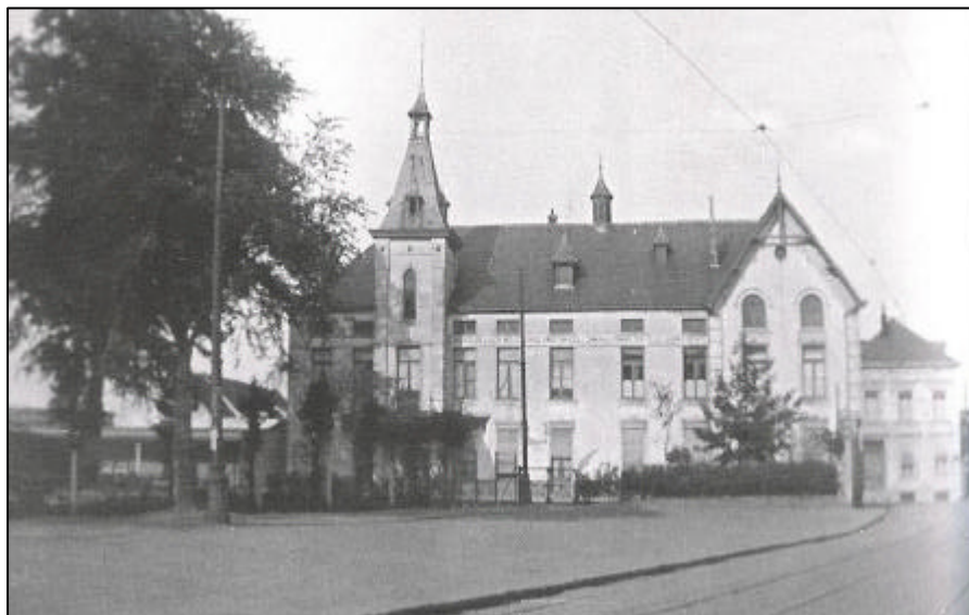
Le Château Convent fut malheureusement détruit en 1951

Au croisement de la chaussée de Roodebeek et de la rue Vervolesem se trouvait une imposante maison appelée Château Convent habitée par le Docteur Crocq. Elle se situait à l'emplacement de l'actuelle maison Dupont et son parc couvrait le clos Marinus.