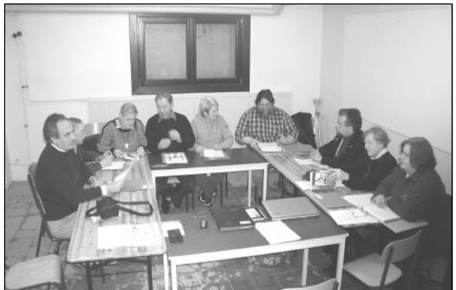
Les membres de CoCoLo au travail lors d'une de leur réunions mensuelles.