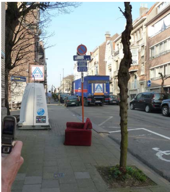
Si le projet se réalise, les livraisons par l'avenue Albertyn ne seront plus le lot quotidien des riverains.