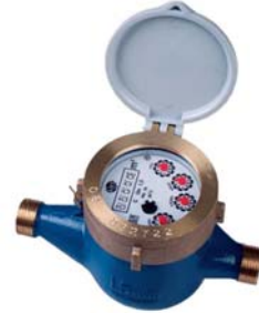
Compteur volumétrique pour l'eau froide, de couleur bleue

La meilleure façon de connaître votre consommation d'ECS est de monter un compteur volumétrique sur l'entrée froide du chauffe-eau.