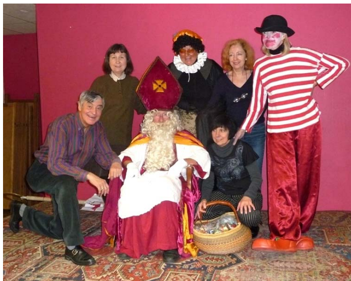
La Saint-Nicolas a été bien fêtée par les comités de quartiers Parvis St-Henri et Prekelinden - Bois de Linthout. Nous espérons que cela a été de même partout ailleurs.

Nous pouvons également pointer positivement notre collaboration avec la Police qui a été attentive à nos demandes lorsqu'elles les concernaient, notamment en intervenant à propos du stationnement illégal qui mettait en insécurité les au-