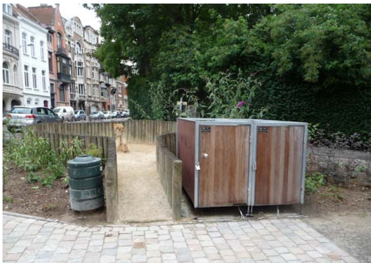
Les deux boxes vélos de la rue Monroe à Schaerbeek sont intégrés à un aménagement paysager et à une canisette

25.000 € pour l'étude du modèle et la fabrication des « boxes vélos ». Un appel a été fait à deux entreprises de réinsertion sociale pour toute