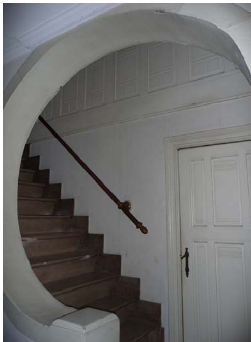
Les photos sont prises à Woluwe-Saint-Lambert.