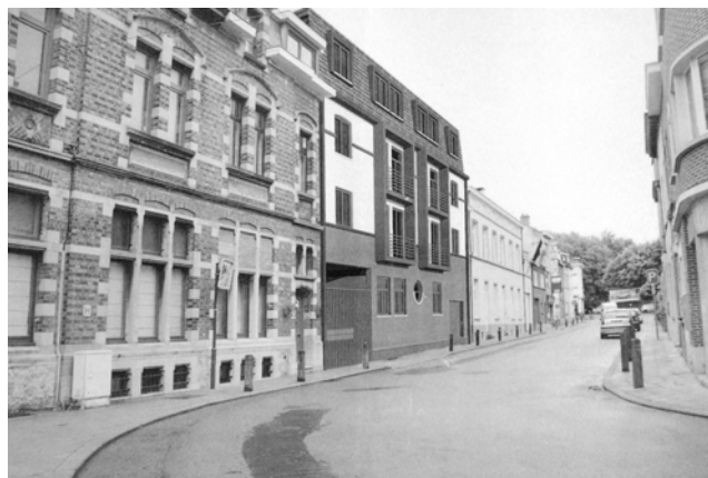
En haut, idée du projet en façade à rue et en bas, idée du projet de l'immeuble en intérieur d'îlot !

En ce qui concerne l'immeuble proposé en façade à rue, nous trouvons qu'il ne s'intègre pas du tout aux immeubles voisins, particulièrement à l'ancienne poste et à l'ancienne ferme rénovée, ses voisines directes.