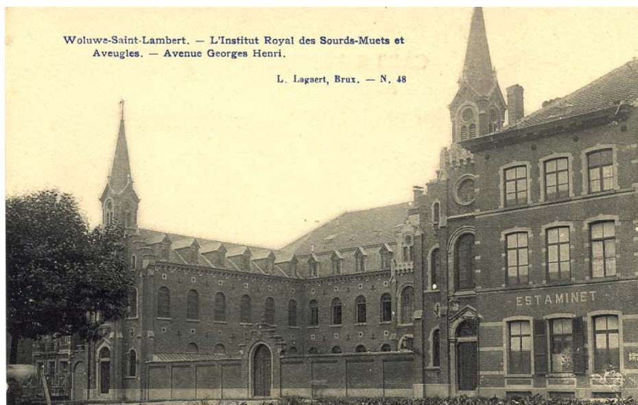
L'estaminet fut remplacé en 1960 par une infirmerie.