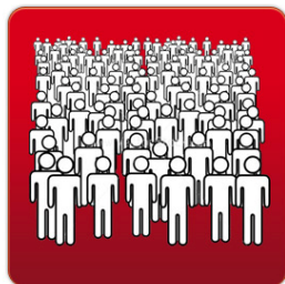
Lots of People