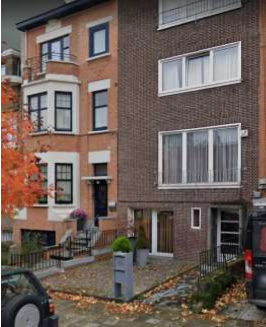
Figure 2 Situation de fait

Nous ne souhaitons pas être convoqués à la commission de concertation qui traitera de ce dossier.